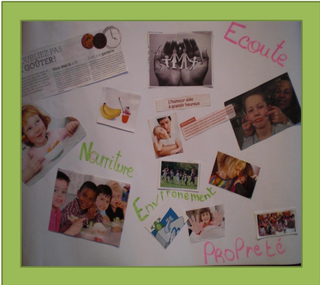
Tableau 1 « vie saine »

2. Le milieu d'accueil veille à la SOCIALISATION en favorisant le développement de la vie en groupe dans une perspective de solidarité et de coopération.