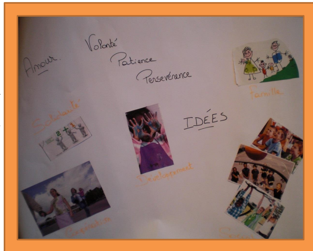
Tableau 2 « Socialisation »

L'accueillante propose des jeux, elle a des idées. Elle fait preuve de patience, de persévérance et de volonté. Elle ne s'isole pas du groupe d'enfants. Elle essaye de gérer les conflits et de trouver des solutions par rapport aux envies parfois débordantes des enfants. Une charte est établie à l'accueil entre enfants et accueillantes pour définir les règles au sein de l'accueil.