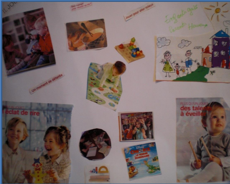
Tableau 3 « place à l'initiative et au temps libre »

Faire découvrir aux parents les créations réalisées pendant l'accueil.